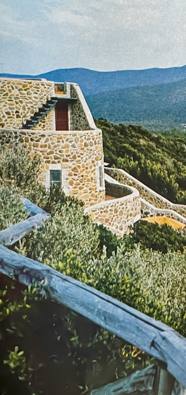
A. Stocchetti, Villa Lorenzini, Punta Ala (da F. Magnaghi, Ville al Mare , 1971)